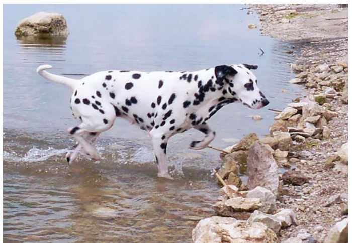
Далматинка Терри. Бугский лиман, 2016 год