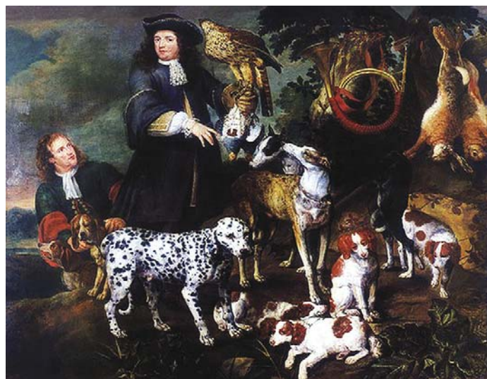
«Охотники на привале», 1640 год. Далматин, грейхаунд и спаниели. Автор: Ян Фейт

В XIX веке далматины стали популярны в Америке, где получили новое прозвище – «пожарная собака». Они принимали участие в поисково-спасательных операциях. В Бостонском пожарном департаменте далматинов обучали доставлять донесения и запасы, инструменты и снаряжение для Красного Креста, охра-