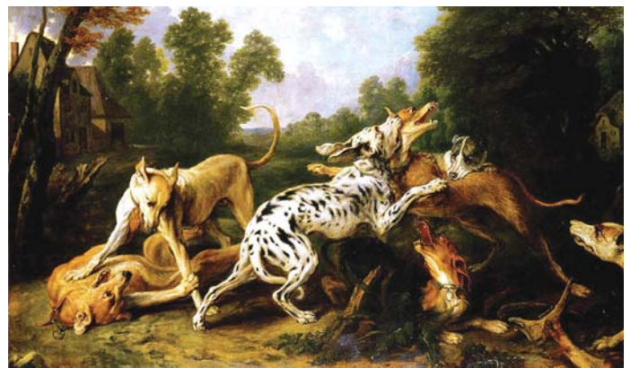
«Собаки, дерущиеся на лужайке», 1609 год. Автор: Франс Снейдерс

гончие псы, в том числе и далматин, ведут свой род от так называемой зольной собаки ( Canis familiaris intermedius – Woldzich), появление которой относят к бронзовому веку (2-3 тыс. лет до н. э.). Останки этих животных